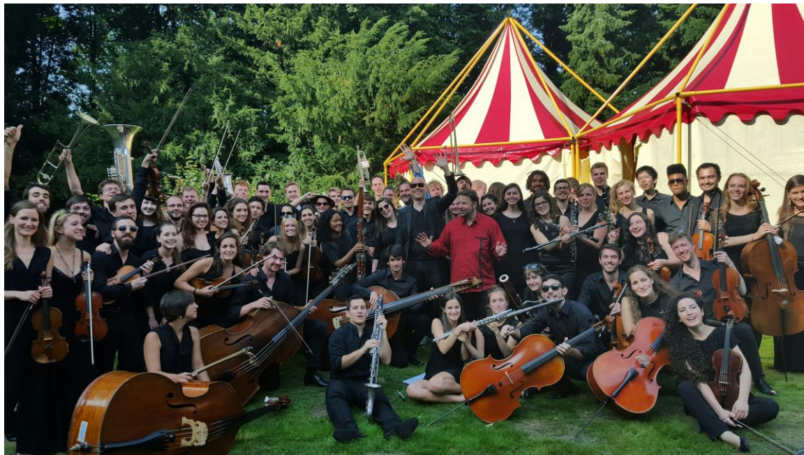
NJJO met het NJO, Goffertpark Nijmegen, 3 augustus 2015

“Vrije Geluiden”, VPRO (uitgezonden 13 september) - reportage