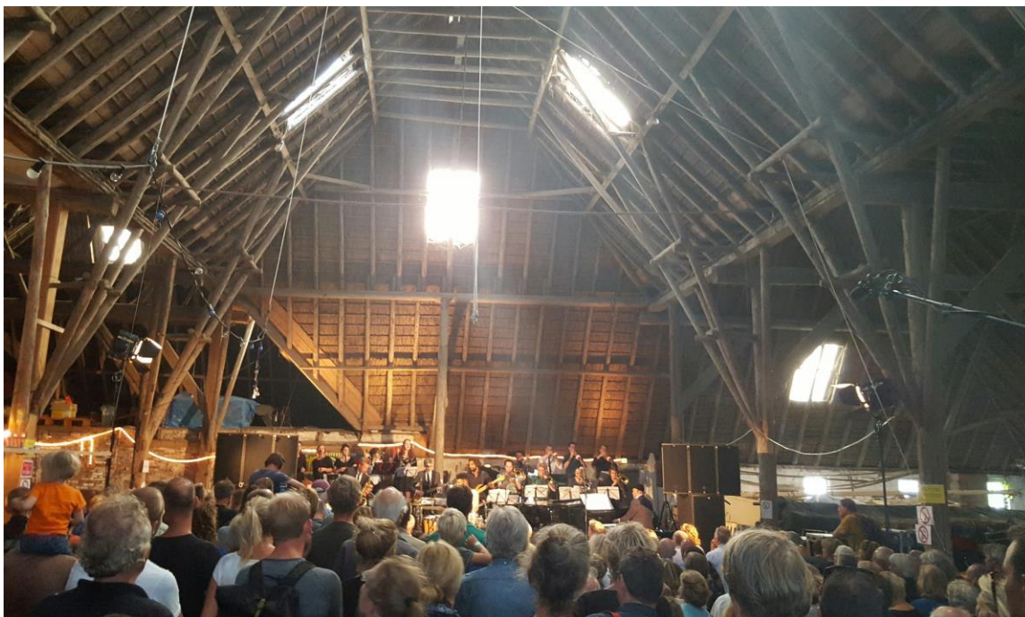
NJJO, 29 augustus Zomerjazzfietstour Groningen

en de harpiste en percussionisten van de Metropole Academy. Het was een prestigieus samenwerkingsproject dat menig toeschouwer in verrukking achter liet.